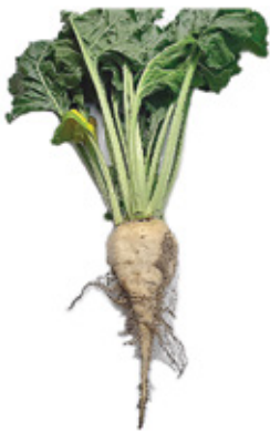
До применения Florahumus