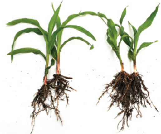
До применения Florahumus