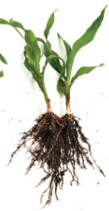
После применения Florahumus