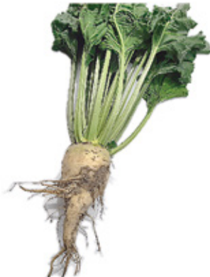
После применения Florahumus